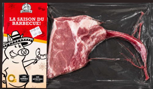
Viandes prêtes à cuire